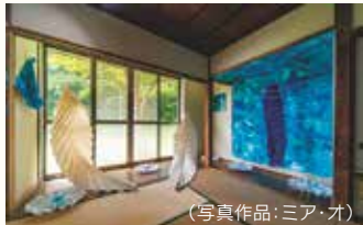
(写真作品:ミア・オ)

中之条町 / 第10回を迎える中之条ビエンナーレ。町全体が会場となる国際現代芸術祭です。文化・自然などに触れながらアートをお楽しみください。